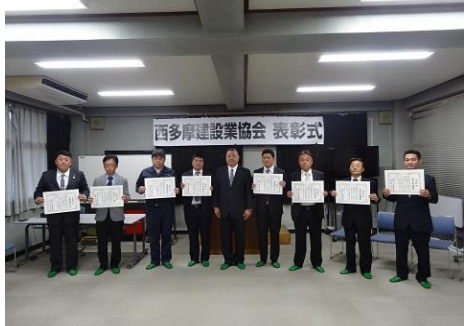
授賞された各社の皆様