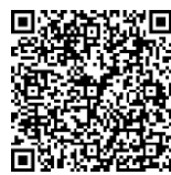
砂防ダム役割動画QRコード