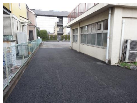
写真②：防災倉庫前通路