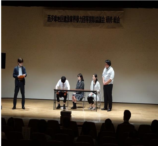
演劇 『とある家族の暴力団排除』

今回の研修(講習)・総会を終え、暴力団排除活動に終わりは無く、常に対策しておかなければならない事であり、今後も警察及び協議会会員のみならずまた連携を取りながら継続して活動していくことが重要だと改めて感じました。