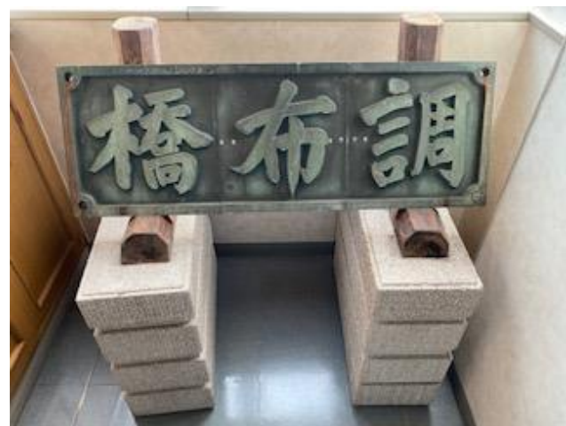
写真④ 初代調布橋 銘板

その初代の橋梁銘版が保存されています(写真④)。取材を受けていただいた方が会社が三代の調布橋をすべて請け負ったこと。各代の橋のメモリアルプレートが会社の前に掲示されています。