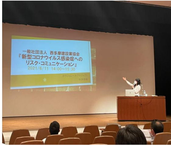
講習会同日の様子 ※ コロナ対策の為、座席間隔を空けています。