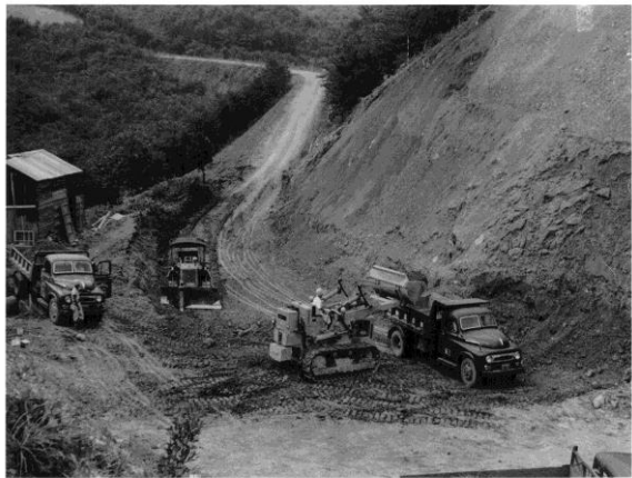
写真① 二ツ塚道路改修工事

その足跡をたどる企画を社団法人の発足に合わせ開始することといたしました。「西多摩の土木遺産「温故知新」と銘打ちました。よろしくお願ひ致します。第一回は、この写真(写真①)から話を始めます。