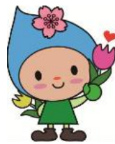
はむりんチューリップ

みなさん こんにちは。 はむりんです。 私はきれいな花と 緑と、お水がとっても おいしい東京都羽村市 にすんでいるりん♡ いろんなはむりんアイ テムもあるりん♡ 羽村市の公式サイ トはむりんの ページに遊び に来て りん♡