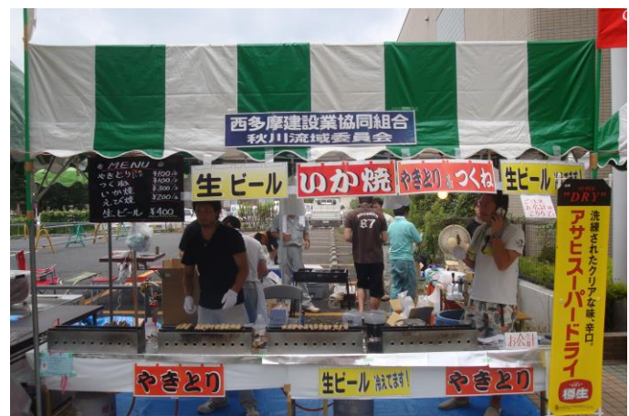
《昨年 の模擬店 写真》