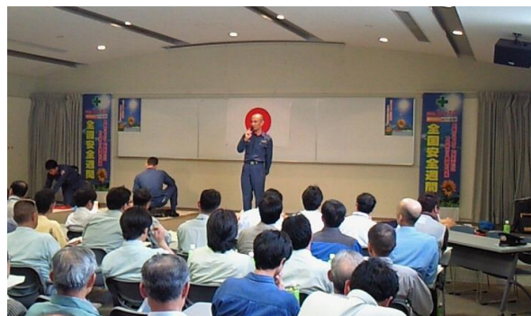
AEDを使つての実技講習

安全大会参加者は、消防署の講師の方の説明に熱心に耳を傾け、特にAEDの使用方法的説明では、受講者が実際に機